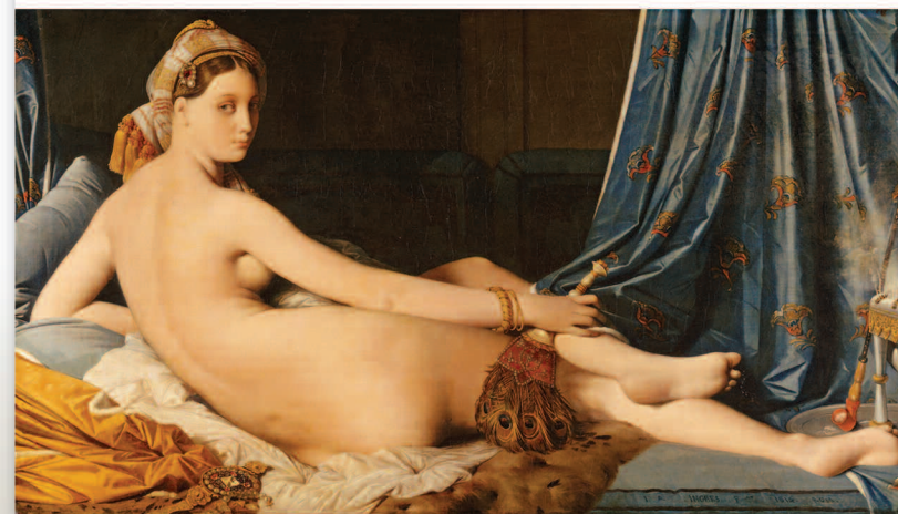
La grande Odalisque, Jean-Auguste-Dominique Ingres

Andere Museen verwenden ebenfalls die Digigraphie von Epson und sorgen durch den Verkauf limitierter Auflagen in den Museums-Shops für zusätzliche Einnahmen. Dazu gehören zum Beispiel das Albert-Kahn-Museum in der Nähe von Paris, das Neue Monaco Museum und das Orleans-Museum.